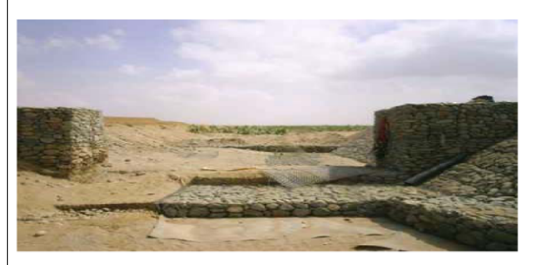
ቫንስተንበር ሽን, 2007