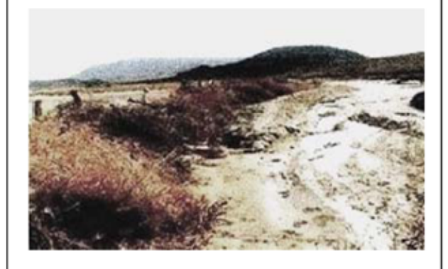
ሳንዱቅ 4: አምናዊ ዓማም (መሓሪ, 2007)

አብ ማእከል ብጨናፍር ናይ አግራብ አብ ማእከል ምእስይ ዉሑጅ ይግበር እዚ ድማ እቲ ጨናፍር ናብቲ ዉሑጅ ዝመጻሉ ወ1ን ከምዝተምት ይግበር እቲ ጉንዲ ድማ አብ መሬት 0.75 ሜ ተፋሒሩ ከምዝአቱ ይግበር.