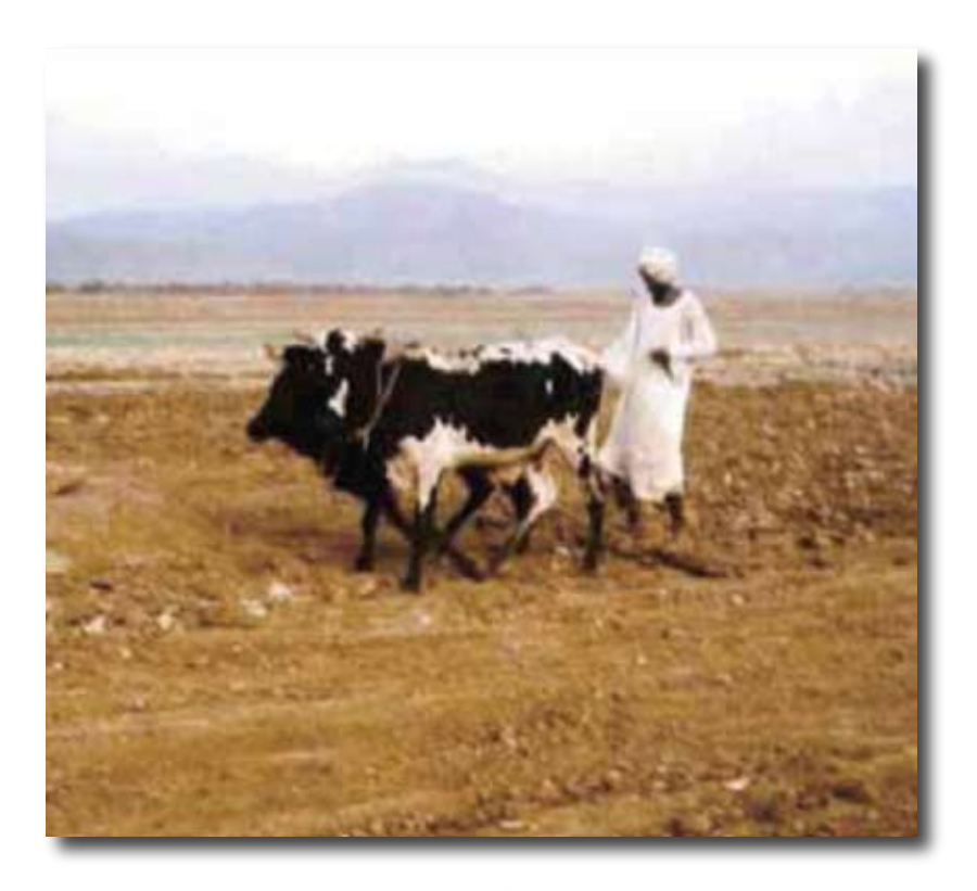
ምዕቃብ ጠሊ ሓመድ (መሓሪ, 2007)