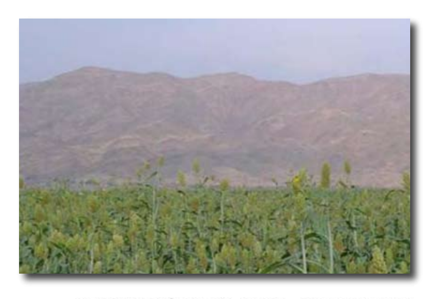
ልምዳዊ ንተፈታት ንምዕባይ ምሀርቲ መሸላ (ሙላሪ, 2007)